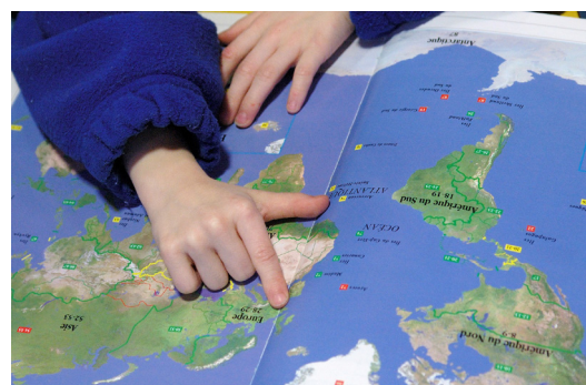
Club de Haikus, Centre Social de Keredern : « L'ailleurs est ici »