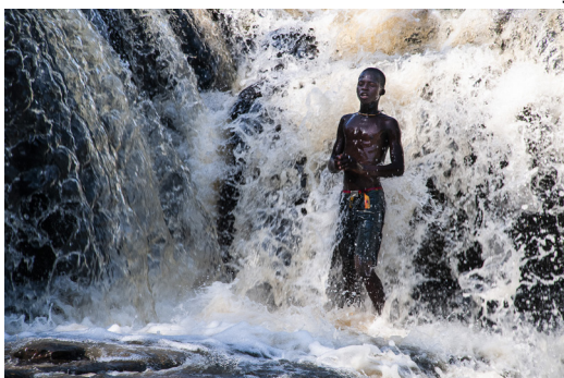
Jacques Yvergnaux : « Afriques Intimes » et « Partir »